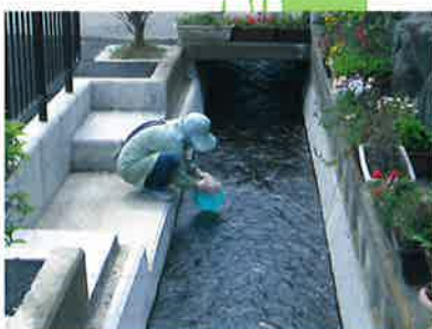
洗い場は日々の生活の一部となっています。