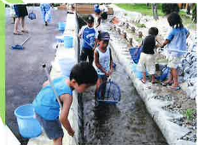
子供たちによる魚つかみ