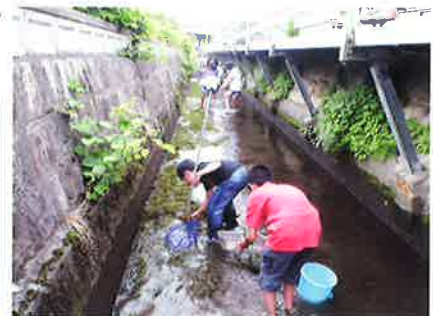
息長小5年生水生生物観察会