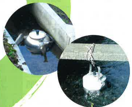
水路が冷蔵庫(井戸)代りとなりお茶を冷やします。