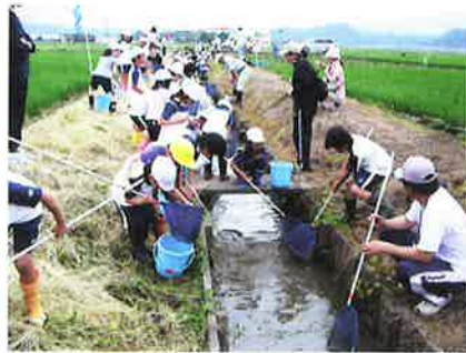
米原小2年生稚魚放流体験