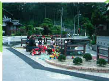
みなさんの憩い・安らぎの場