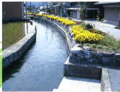
きれいに植栽された水路沿いの様子