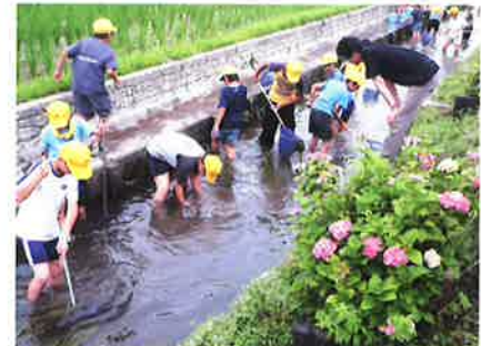
坂田小5年生水辺の集い親子活動