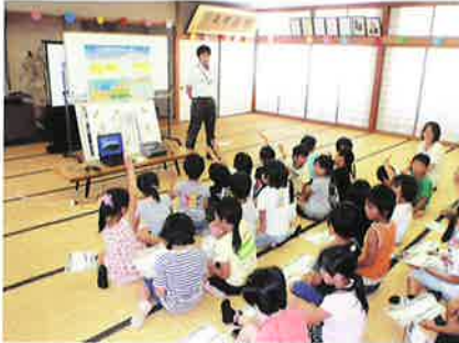
息長小2年生ゆりかご水田出前授業

本年度も各小学校や農村まるごと保全向上対策集落活動組織、関係機関と連携を図り、ニゴロブナの稚魚放流体験学習会、水生生物観察会や水質調査学習等を実施しました。子供たちが、環境や水の大切さ、生き物や自然の保全等に関心を持ってくれることを願い今後も活動を展開していきたいと思ひます。