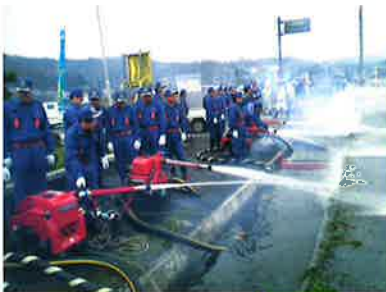
防火用水としての利用

このように、今後も引続き適正な維持管理体制づくりを進めていきたいと思っておりますので皆様のご理解とご協力をお願いいたします。