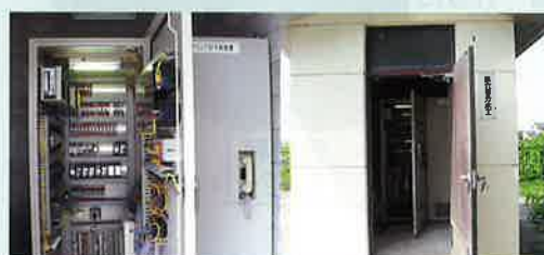
天の川揚水機場から分水工等(計15箇所)との 遠方監視制御装置及び機側計装盤