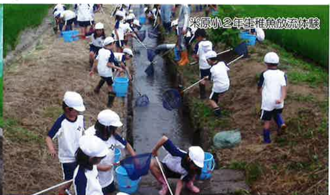
米原小2年生稚魚放流体験