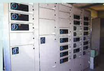
コントロールセンター