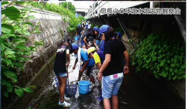
息長小5年生水生生物観察会