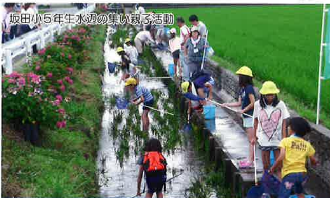
坂田小5年生水辺の集い親子活動