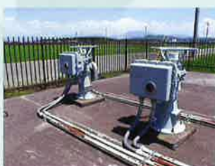
分水工バルブ (14箇所)